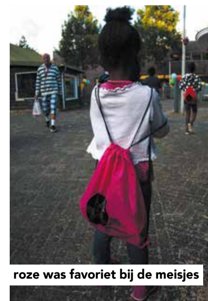
roze was favoriet bij de meisjes